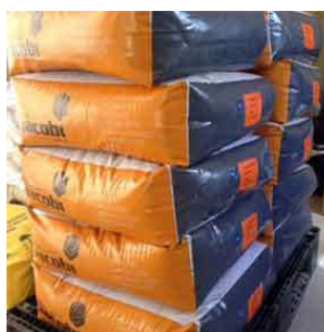
Мешок 25 кг