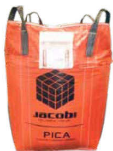
Биг-Бэг 500 кг