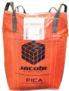
Биг-Бэг 500 кг