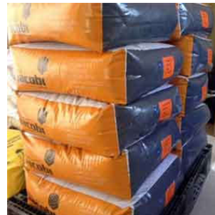
Мешок 25 кг