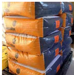
Мешок 25 кг 20 мешков на поддоне