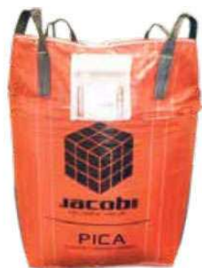
Биг-Бэг 500 кг 2 Биг-Бега на поддоне